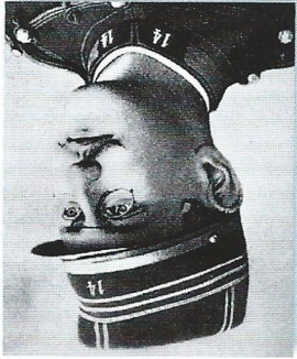
Alfred Dreyfus (1859-1935).

► Sur le site www.dreyfus.culture.fr , cliquez Dreyfus et les siens puis L'engagement des proches . Qui soutient Dreyfus à partir de 1895 ? Qui est Bernard Lazare ?